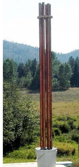
Готовый «облачный укротитель»

Всегда будьте очень разборчивы, в какой НЛО вы целитесь. Если они не вражеские и вы их разозлите, то они могут вам ответить и попортить ваш карбюратор или что-то вроде него, как однажды испортили нам. По-настоящему продвинутые «леталки» не восприимчивы к укротителю облаков, т.к. вероятнее всего они не используют энергию оргона для полета. Мы думаем, что почти все они прибегают к ядерному синтезу или какому-либо другому подобному ядовитому устаревшему виду энергии. Насколько нам известно, сейчас открыт сезон вражеских воздушных суден “B Sirian” и им подобных. Хотя конечно они не причинят вам вреда, особенно если вы их не боитесь. Всеобщий закон накладывает на них большие ограничения, чем на нас: если мы можем позже поплатиться за его нарушение, то они (скорее всего) вообще не могут его нарушить.